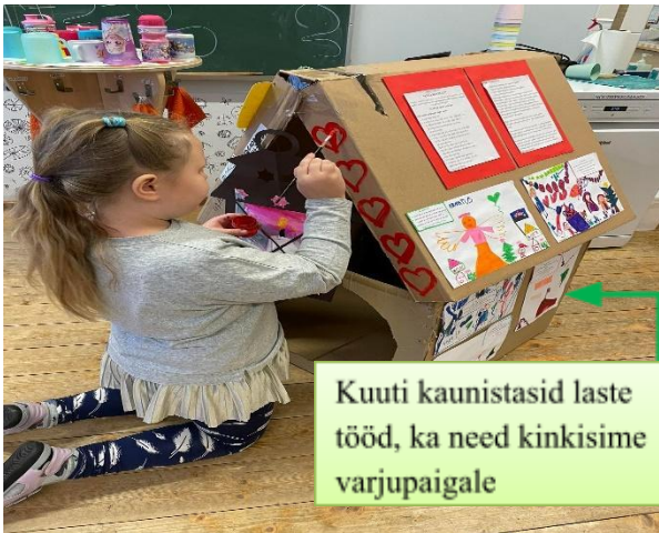
Kuuti kaunistasid laste tööd, ka need kinkisime varjupaigale