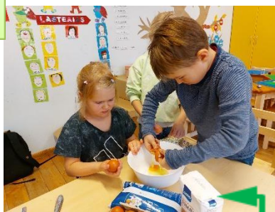
Vahvlitegu laadaks. Koostöös kooliga, on meil võimalus igal ajal kasutada kodundusklassi